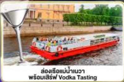
ล่องเรือแม่น้ำวอวา พร้อมเสิร์ฟ Vodka Tasting