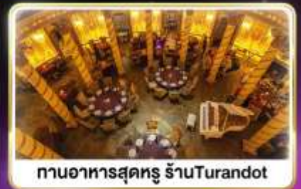
ทานอาหารสุดหรู ร้านTurandot