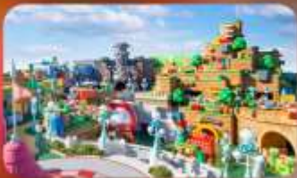
อิสระท่องเที่ยว