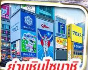
ย่านชินโซบะชิ