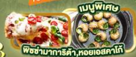
เมนูพิเศษ พิซซ่ามากริตต้า, หอยเอสคาโก้