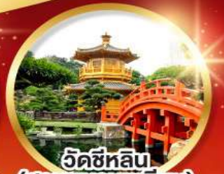
วัดซีหลิน (สวนหนานเหลียน)