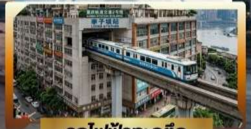
รถไฟฟ้ากะลุดัก