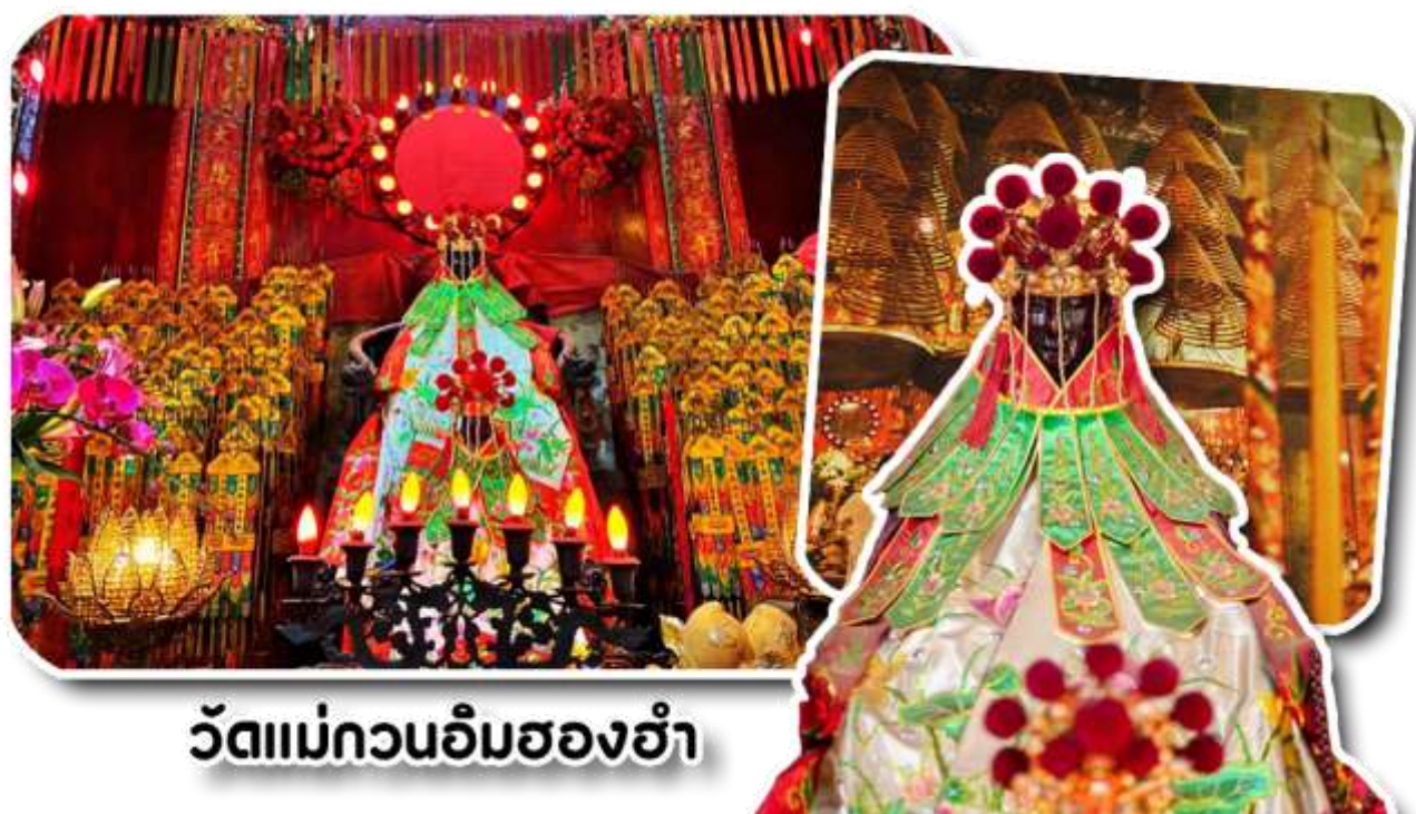
วัดแม่กวนอิมฮองฮำ

พาท่านเดินทางไปไหว้ขอพรขอเงิน วัดแม่กวนอิมฮองฮำ วัดเก่าแก่ของฮ่องกงสร้างตั้งแต่ปี ค.ศ. 1873 เป็นวัดขนาดเล็กที่มีชาวฮ่องกงศรัทธานับถือกันเป็นอย่างมาก วัดแห่งนี้เป็นที่ประดิษฐาน องค์เจ้าแม่กวนอิมฮองฮำ ที่มีชื่อเสียงเรื่องการให้กู้ยืมเงิน เชื่อกันว่าท่านช่วยพลิกฟื้นเศรษฐกิจของชาวฮ่องกง ผู้คนจึงนิยมมาเยี่ยมเงินทำธุรกิจจนสำเร็จร่ำรวย รุ่งเรือง โดยให้ท่านอธิษฐานขอพรต่อหน้าเจ้าแม่กวนอิมฮองฮำ พร้อมกับระบุวันเวลาในการขอพรด้วย จากนั้นนำธูปธบายตามฐานะและศรัทธาที่เราจะนำเป็นสื่อในการขอพร เขียนจำนวนเงินที่ต้องการลงไปด้วย ใส่สกุลเงินยิ่งดีใหญ่ แล้วนำเงินใส่ในซองแดง ควรเตรียมซองแดงไปเอง นำซองแดงไปวางรอบกระถางรูป วนขวาจำนวน 3 ครั้ง แล้วเก็บซองแดงในกระเป๋าสตางค์ เป็นเงินขวัญถุง ถ้าประสบความสำเร็จตามที่มุ่งหวัง ให้นำเงินในซองแดงทำบุญหยอดตู้ที่วัดแห่งนี้ในโอกาสต่อไป วิธีไหว้ให้ปัง ให้ได้โชคลาภเงินทอง ต้องไปกับเราเท่านั้น