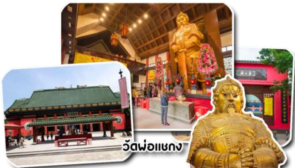
วัดพ่อแซกง

นำท่านเดินทางสู่ วัดแซกง วัดที่ชาวฮ่องกงให้ความเลื่อมใสศรัทธามาเนิ่นนานสร้างขึ้นเพื่อระลึกถึงตำนานนักรบแห่งราชวงศ์ซ่ง เทพเจ้าแซกง แม่ทัพปราบศึกที่กล้าหาญ ในกองทัพของท่านยามที่ออกรบเพื่อต้านข้าศึกศัตรูทุกทิศทางทุกๆครั้งท่านจะใช้สัญลักษณ์รูปกังหัน 4 ใบพัด ติดไว้ด้านหน้ารถศึกนำขบวนในกองทัพของท่าน ซึ่งท่านมีความเชื่อว่าเมื่อพกพาสัญลักษณ์รูปกังหันนี้ไปไหนที่ใดๆกังหันนี้จะช่วยเสริมสิริมงคลนำพาแต่ความโชคดีมีอำนาจเข้มแข็งเสริมกำลังใจให้แก่กองทัพของท่านชื่อเสียงในการนำทัพสู้ศึกของท่านจึงเป็นตำนานมาจนทุกวันนี้