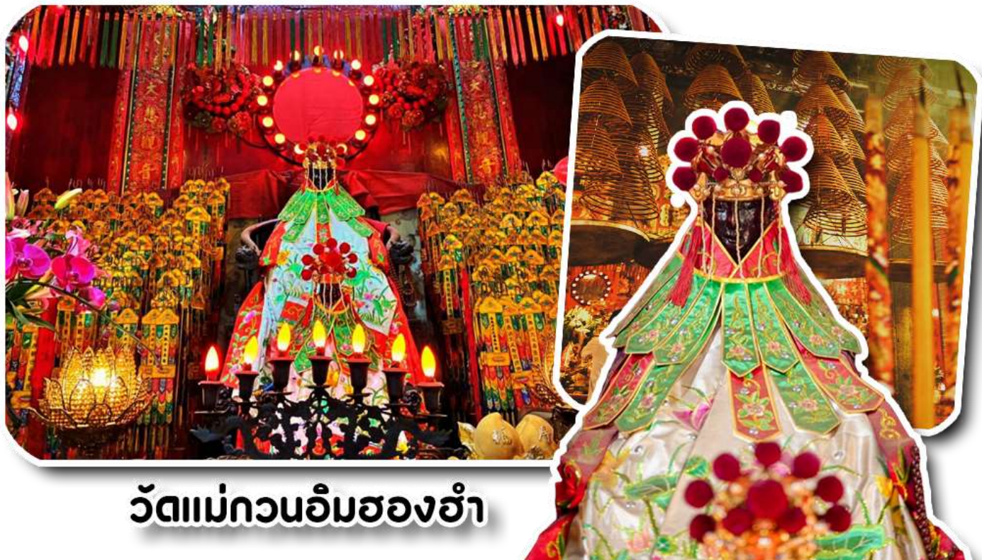
วัดแม่กวนอิมฮ่องฮ่า

เป็นวัดขนาดเล็กที่มีชาวฮ่องกงศรัทธาแน่นถือกันเป็นอย่างมากวัดแห่งนี้เป็นที่ประดิษฐาน องค์เจ้าแม่กวนอิมฮ่องฮ่า ฮ่า ที่มีชื่อเสียงเรื่องการให้กู้ยืมเงินเชื่อกันว่าท่านช่วยพลิกฟื้นเศรษฐกิจของชาวฮ่องกง ผู้คนจึงนิยมมาขอยืมเงินทำธุรกิจจน