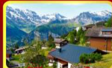
หมู่บ้านเมอร์เสน