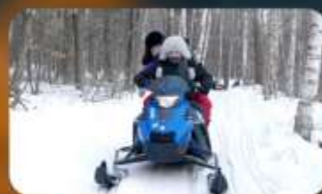
จักรยาน SNOW MOTORCYCLE