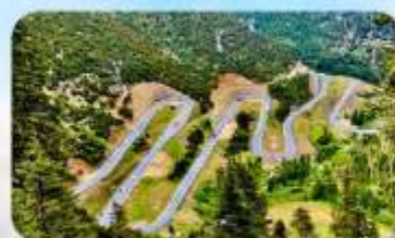
ถนน 18 โค้ง