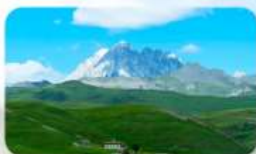
ทุ่งหญ้าด่าง