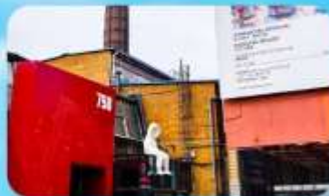
798 Art Zone