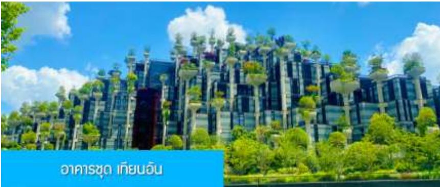
อาคารชุด เทียนอัน