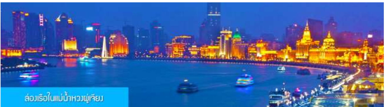
ล่องเรือในแม่น้ำหวงพูเจียว