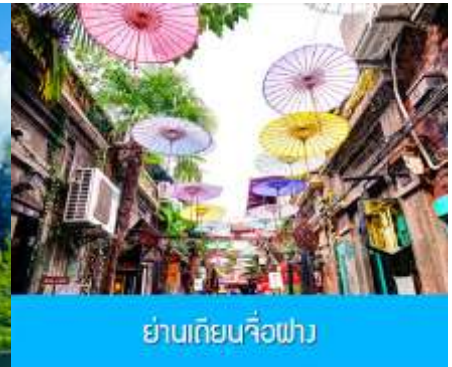
ย่านเทียนจื่อฟาง