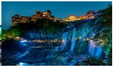
ฟูหรงเจิน

*ทางบริษัทฯ ขอสงวนสิทธิ์ในการสลับโปรแกรมทัวร์ตามความเหมาะสมขึ้นอยู่กับสถานการณ์หน้างาน โดยคำนึงถึงผลประโยชน์ของลูกค้าเป็นสำคัญ