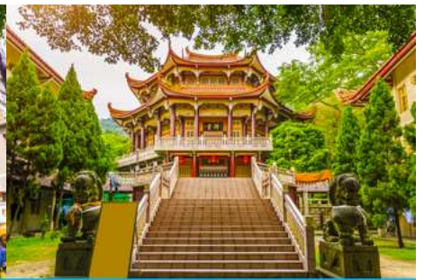
วัดหนานกั๋วซื่อ