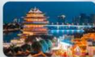
ถนนสามสายสองตอรอก