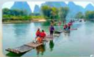
ล่องแพไม้ไผ่ที่ทง