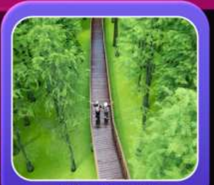
"ป่าสนชิงซาน"

5 วัน | 4 คืน น้ำหนักกระเป๋า 20 กก. ประกันอุบัติเหตุ + ประกันสุขภาพ