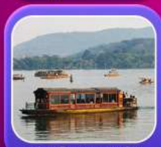
"ล่องเรือทะเลสาบซีหู"