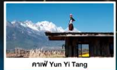
คาเฟ่ Yun Yi Tang