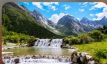
ปี้ฝิงโกว