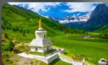
กุเวาสีครุณี