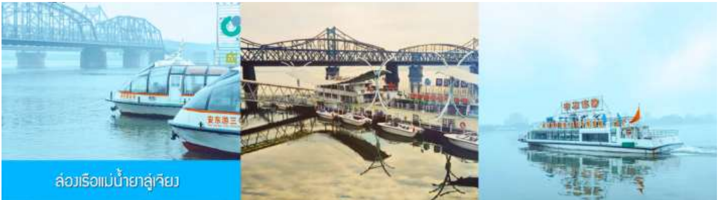
ล่องเรือแม่น้ำยาลูเจียง

หลังอาหารให้ท่านพักผ่อนตามอัธยาศัยในโรงแรม