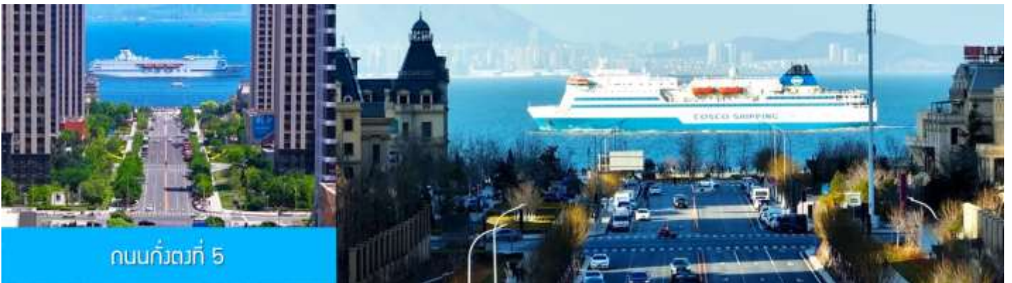
ถนนกั๋วตงที่ 5

หลังอาหารนำท่านเที่ยวชม ถนนกั๋วตง 5 港东五街 จุดเช็คอินใหม่ที่ได้รับความนิยมอย่างสูงจากนักท่องเที่ยว