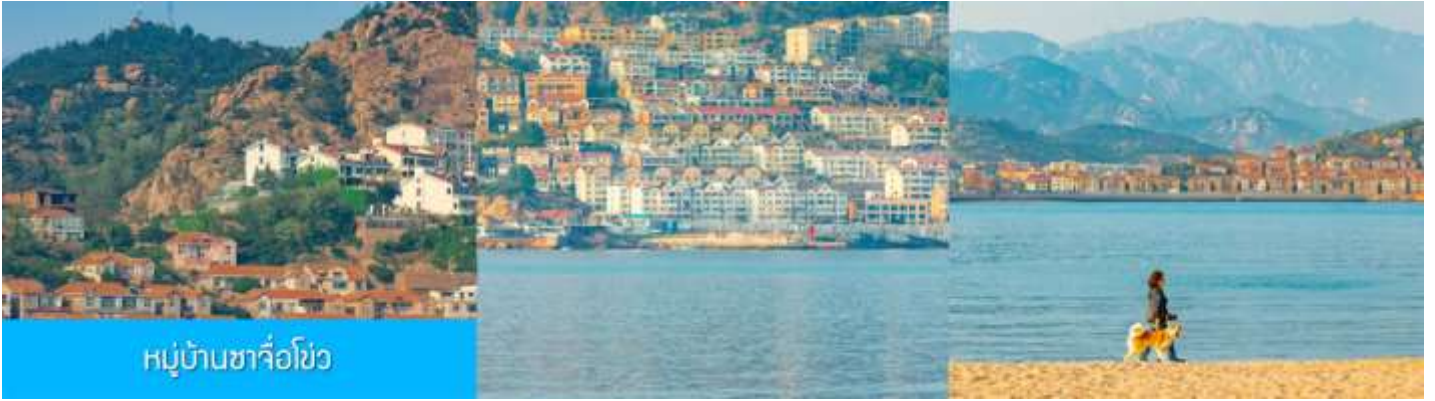
หมู่บ้านซาโจโฮว