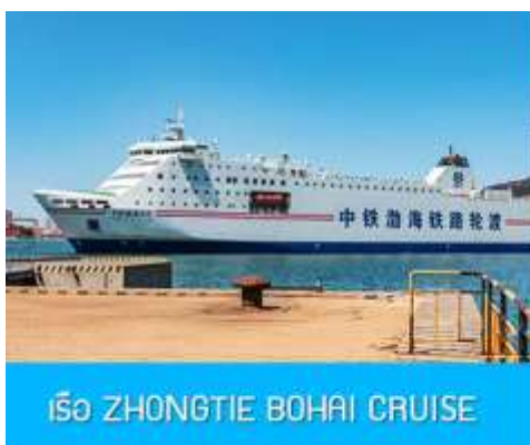
เรือ ZHONGTIE BOHAI CRUISE

เมื่อเวลาแก่เวลา นำท่านขึ้นเรือ ZHONGTIE BOHAI CRUISE เพื่อเดินทางสู่เมืองต้าเหลียน