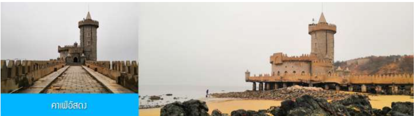
คาเฟอัสถว