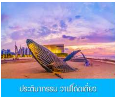
ประติมากรรม วาฬโด้ดเดี่ยว