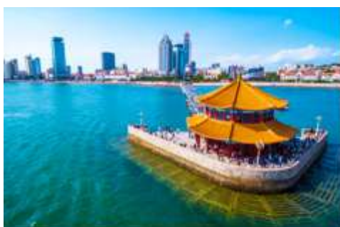
สะพานเจียงเจียว

เช้า รับประทานอาหารเช้า ณ ห้องอาหารของโรงแรม (1)