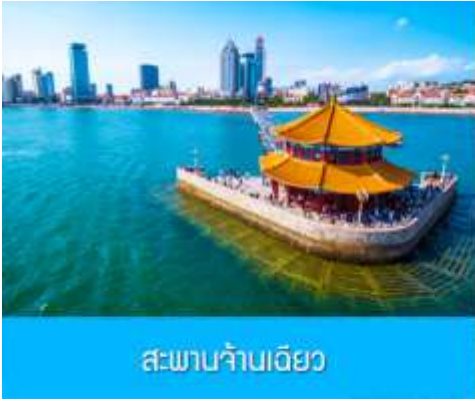
สะพานจ้านเฉียว