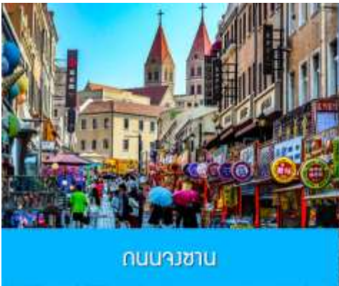
ถนนวางซาน