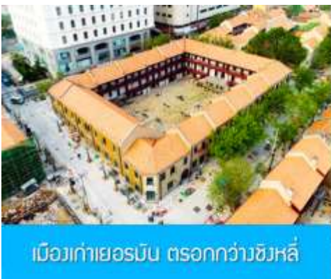
เมืองเก่าเยอรมัน ตรอกกว่างซิงหลี่