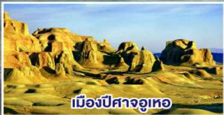
เมืองปีศาจอุเทอ