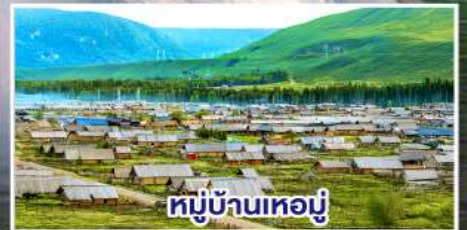
หมู่บ้านหอบู