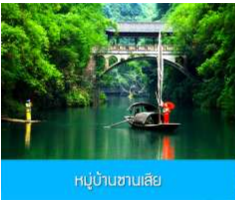
หมู่บ้านซานเสี