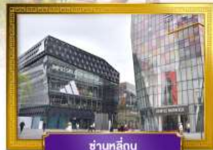
ชานหลู่กุน