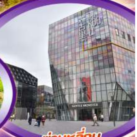
ชานหลู่ทง