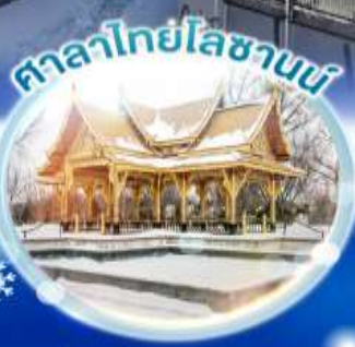
ศาลาไทยโบราณ