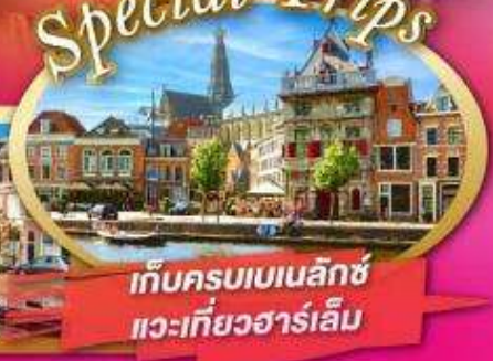
เก็บครบเบนลักซ์ และเที่ยวฮาร์เล็ม