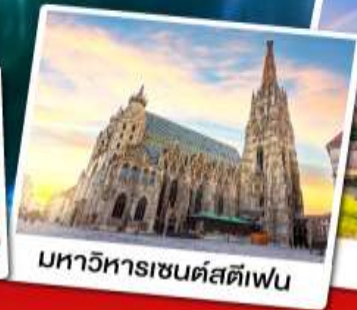
มหาวิหารเซนต์สตีเฟ่น