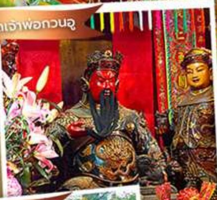
วัดหลินพาทง